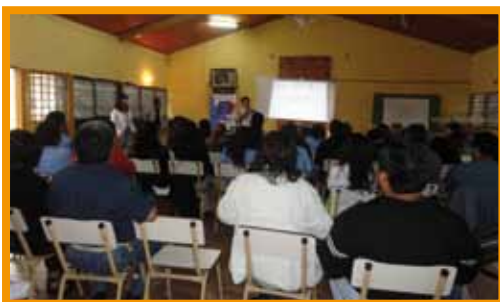
Capacitación en consejería

Se ha capacitado a 55 efectores de salud pertenecientes a los tres CAPS involucrados, al Hospital Snopek y a referentes de organizaciones locales y escuelas de las zonas de intervención. La capacitación se realizó durante los meses de noviembre y diciembre de 2011 de manera itinerante por los tres centros de salud y, se han trabajado temas relacionados a los aspectos clínicos y epidemiológicos del VIH/SIDA e ITS en la provincia, abordajes del HIV/SIDA en el primer y segundo nivel de atención, prioridades en salud sexual y reproductiva (SSR) en el marco de los Derechos Humanos y contenidos relacionados a la identidad de género y el respeto a la diversidad sexual, así como herramientas específicas para el trabajo en consejerías y el testeo voluntario.