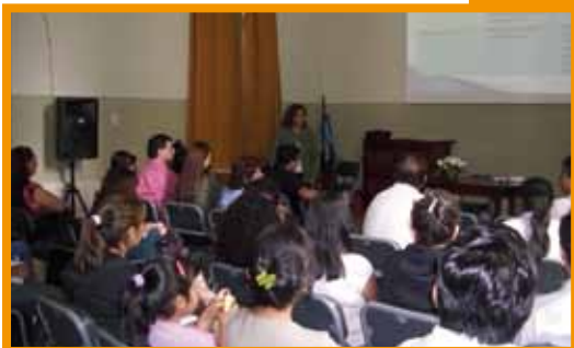
Capacitación en procedimientos, manejo y profilaxis