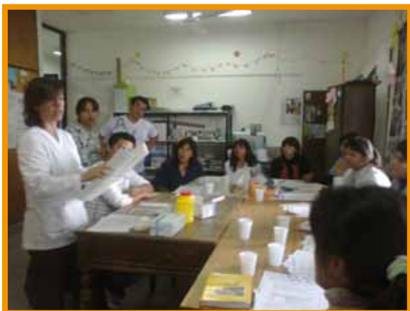
Capacitación para la realización del testeo a través de las pruebas de inmunoensayo (Test Rápido)

En este marco, se acordó con el Programa Provincial de Lucha contra el Sida, el Hospital Snopek y los CAPS el desarrollo de nuevas estrategias que permitan aumentar el testeo de VIH en población general, mediante la realización de un estudio piloto para la aplicación de testeo rápido, el cual se realizó en los tres CAPS durante los meses de marzo y abril de 2012. Los objetivos del estudio se orientaron a analizar la aceptabilidad del test rápido de VIH en el primer nivel de atención y su efectividad como estrategia para resolver barreras de acceso y ampliar la oferta de testeo; e identificar el perfil socio-demográfico y los factores de vulnerabilidad frente al VIH en la población usuaria de los CAPS en la zona de intervención. A partir de este estudio se definió un algoritmo para los casos reactivos a fin de garantizar los estudios confirmatorios en menos de una semana.