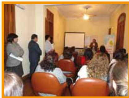
Presentación del proyecto a nivel provincial

El 19 de septiembre de 2011 se realizó el acto de presentación oficial con la presencia del secretario de Planificación en Políticas y Regulación del Ministerio de Salud de la Provincia de Jujuy y referentes de dicha secretaría, jefes y efectores de salud de los tres CAPS involucrados, autoridades de la Unidad de Retrovirus del Hospital San Roque, Delegado del Inadi Jujuy, Abogados de DDHH, autoridades de la Municipalidad de San Salvador de Jujuy, y activistas vinculados al VIH, entre otros participantes.