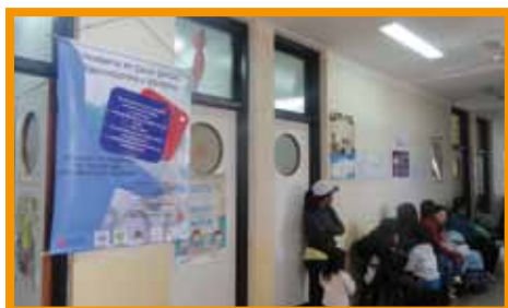
Materiales de comunicación elaborados en el marco del proyecto

Se trabajó conjuntamente con los equipos de los tres CAPS en el diseño y validación de los materiales de difusión. A partir de la realización de encuentros con referentes de los servicios de consejería y con la colaboración de estudiantes avanzados de la carrera de Comunicación Social de la UNJU, se han elaborado 3 banners movibles para la difusión de las consejerías en actividades comunitarias, carteles del mismo tenor para hacer difusión en organizaciones locales, y un folleto informativo para ser utilizado en el trabajo cotidiano de las consejerías.