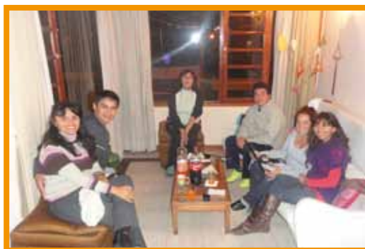
Encuentros de sistematización y grupo focal

Se han evaluado los instrumentos provinciales y nacionales para proponer un registro unificado para todas las consejerías y los hospitales involucrados. Además, en el marco de la implementación del proyecto, la coordinación general del mismo a cargo de Fundación Alvarado y Fundación Huésped ha realizado el registro escrito y la memoria fotográfica de las acciones implementadas en el marco de la iniciativa Tratamiento 2.0.